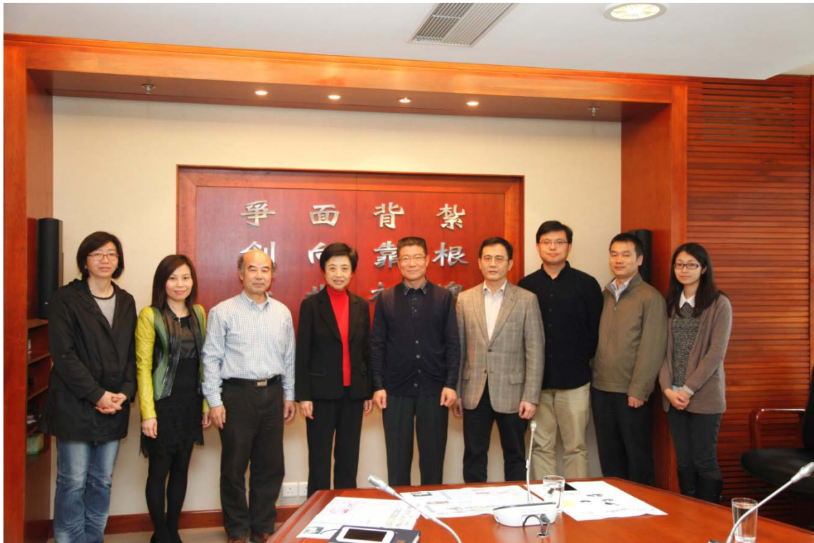
澳門理工學院理事會成員 與《澳門理工學報》編輯團隊合影（2015 年 4 月）

次文獻中也有較高的轉載率。2016 年度，《新華文摘》轉載了郭英德教授的《喧囂與寂寞：1616 年前後劇作家湯顯祖的自塑與他塑》等文；《中國社會科學文摘》轉載了王思斌教授的《中國的社會政策話語體系與實踐特點》以及羅福惠教授的《記憶史拓展孫中山研究空間》等文章；《高等學校文科學術文摘》轉載了陶一桃、劉洪濤、王藝瑾、蔡赤萌、吳琦幸、唐小林等學者的文章。