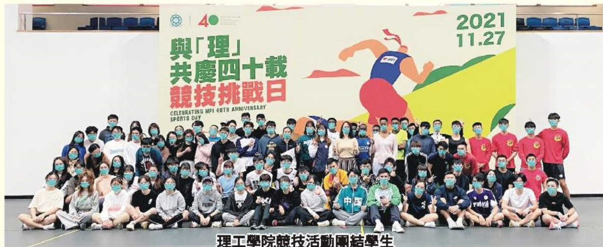
理工學院競技活動團結學生

澳門理工學院以積極推動青年的全人發展為目標，透過舉辦多元化的校園活動以發揮學生個性特長，致力促進學生身心健康成長及鼓勵學生建立健康生活模式。學生事務處推出一系列活動，在校園傳播團結互助、上下一心的精神，加強學生的歸屬感，提升學生的身心素質，為澳門及國家培育身心全面發展的優質人才。