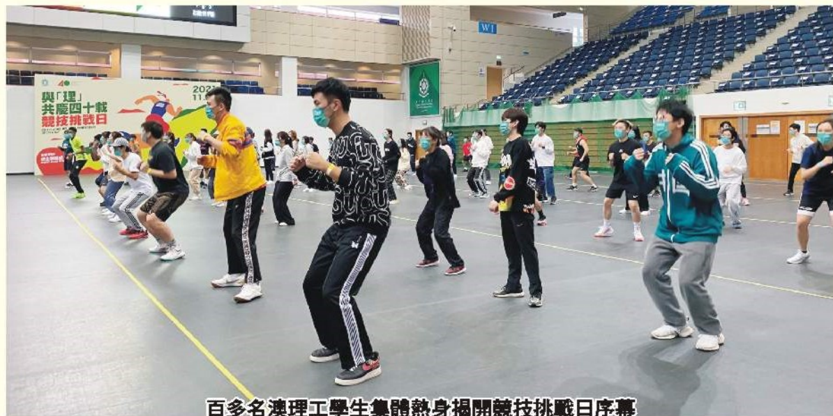
百多名澳理工學生集體熱身揭開競技挑戰日序幕